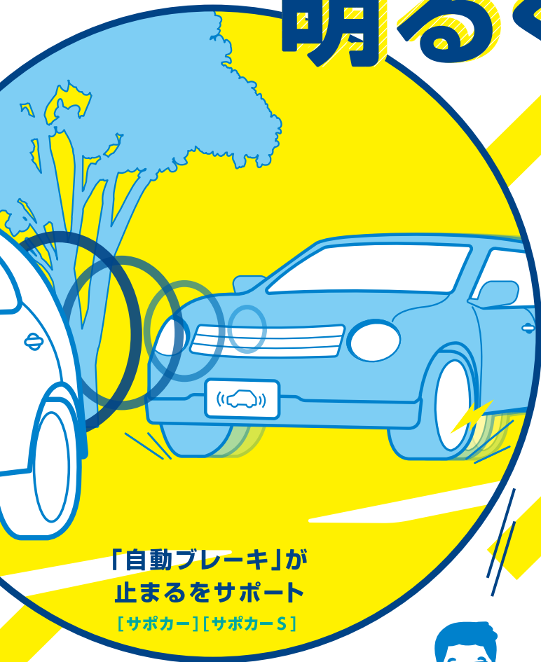
「自動ブレーキ」が 止まるをサポート [サポカー][サポカー-S]