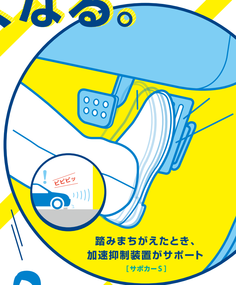
踏みまちがえたとき、 加速抑制装置がサポート [サポカー-S]