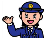
臨時認知機能検査の対象となる18項目の違反（一定の違反）

認知機能が低下すると行われやすいとされる「信号無視」、逆走などの「通行区分違反」、「指定場所一時不停止」、「横断等禁止違反」など、18項目の違反が対象となります。（詳細は下の表のとおり）