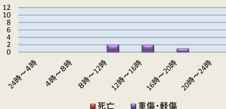
時間帯別事故発生状況(令和2年1-6月)