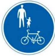
自転車及び歩行者専用標識