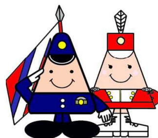
秋田県警察マスコット・キャラクター 「まもるくん」「あいちゃん」

この計画を効果的かつ円滑に推進するため、「秋田県警察機能強化プラン」推進委員会設置要綱の制定について（例規）」（令和元年6月7日付け秋本務第439号）に基づく「秋田県警察機能強化プラン」推進委員会等において、その進捗状況を報告し、改善方策について検討することとします。