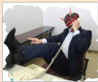
← 鹿角署オリジナルキャラクター 特殊詐欺撲滅侍