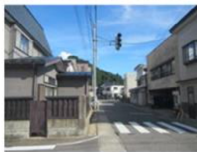
※ 生活道路のイメージ