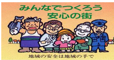
秋田県警察本部・(社)秋田県防犯協会連合会