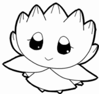
しゃくこまちちゃん