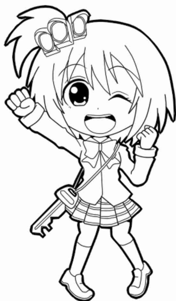
かぎ 鍵かけキーちゃん