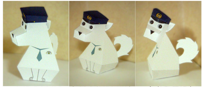
正面から見ると 右斜めから見ると 右から見ると

右下の組立参考図のように、顔の部分は印刷した方 が内側になるように、間違わずに組立ててください。