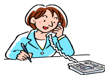
主任ケアマネジャー