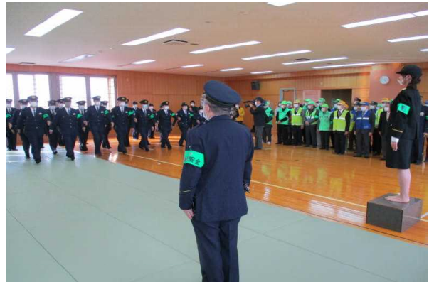
～金融機関等への呼びかけ～