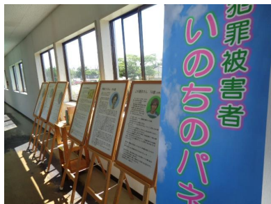
＜北日本自動車学校＞