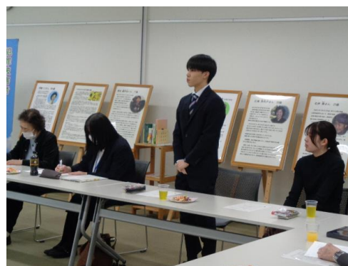
<大学生ボランティア研修会>