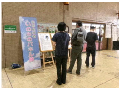
＜大館市民文化会館＞