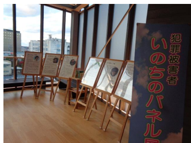
<あきた芸術劇場ミルハス>